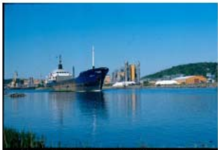
Utöta Åby, både båtarna och släckningsutrustning, Bild: Utöta Åby stad